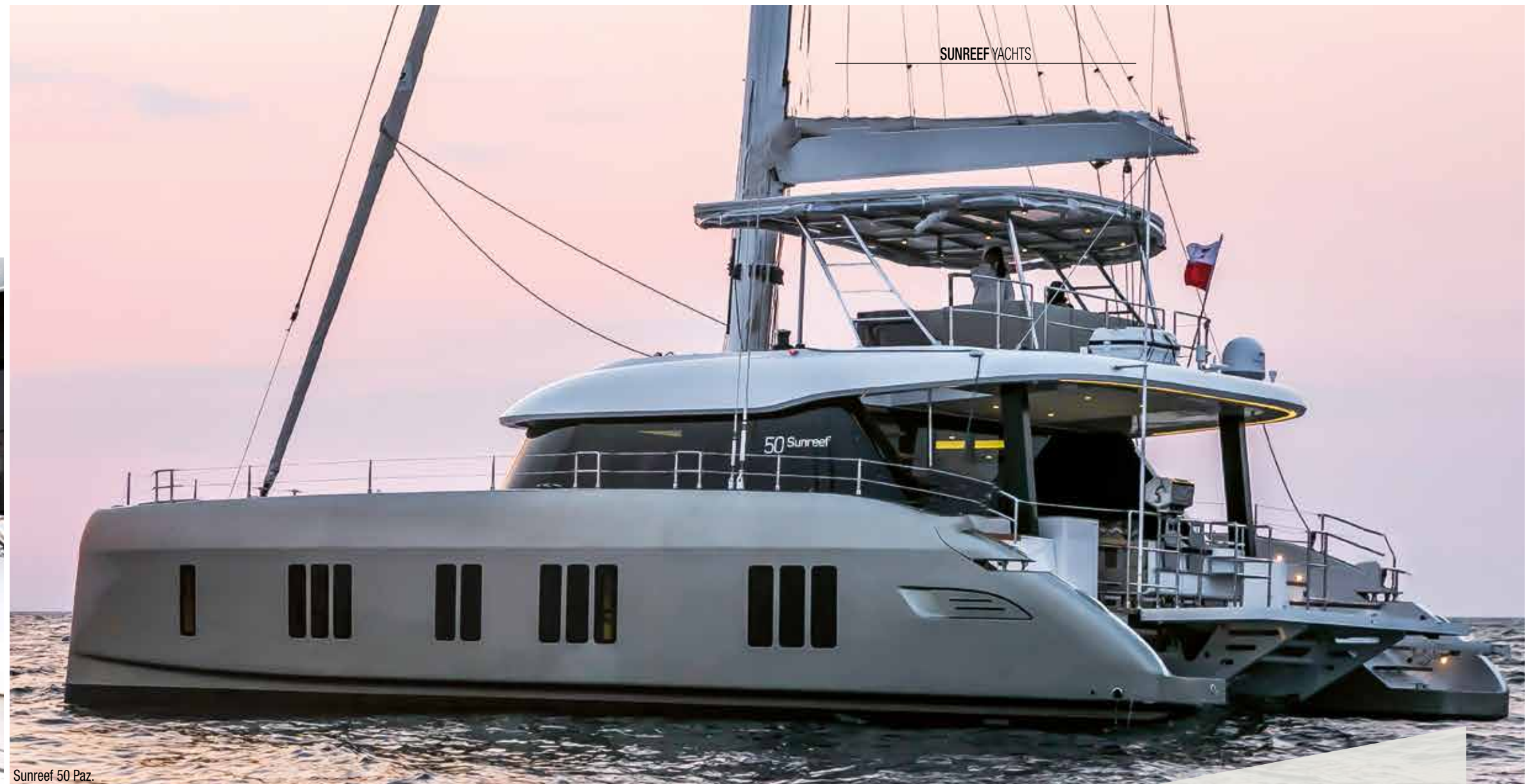
Sunreef 50 Paz.

Sunreef Yachts has a worldwide presence, with sales offices in Poland, Dubai, Miami and Montenegro.