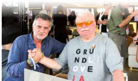
Fabio Massimo Bonini and Lech Walesa.

Horizon, still accompanied by Artur, my guide: «The Sunreef 80 Endless Horizon is elegant and versatile, blending contemporary design with intelligent layouts and trustworthy performance under sail for offshore navigation, in complete luxury. The living areas are huge, including an immense kitchen on the main deck. This exclusive vessel is an original version of Sunreef Yachts' best-selling sailing catamaran». One of the most striking relaxation areas is the immense flybridge. It is fitted with a bar, large sun loungers, a lunch table and all of it is really wide open, with the feeling of being infinite, perfectly in keeping with the name of the boat itself.