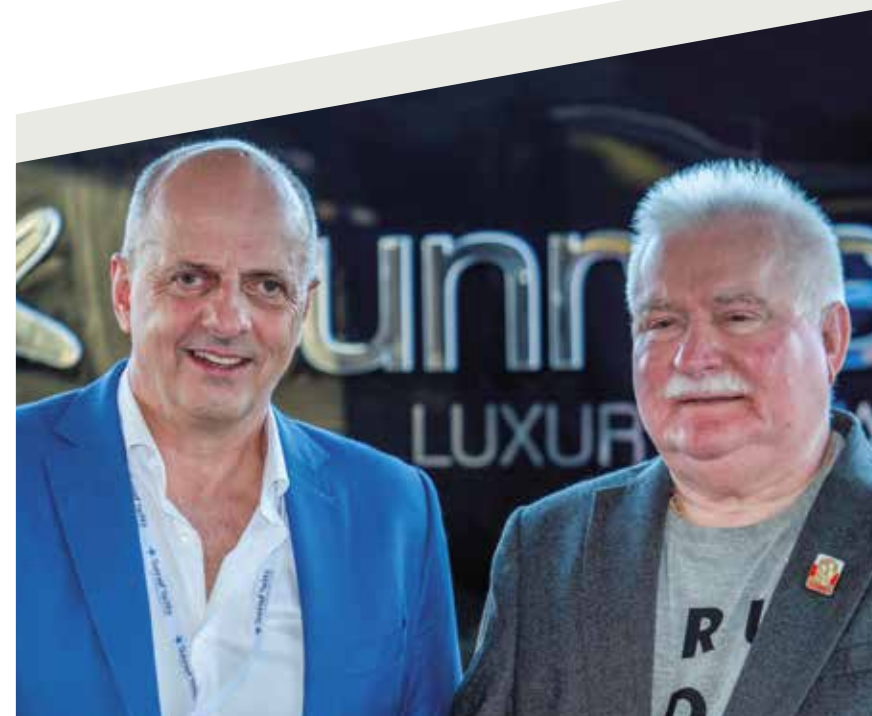
Francis Lapp and Lech Walesa.

cruising. It is set to sail throughout the world, and provides the highest level of comfort, while staying dependable and easy to handle. It is a boat that is perfect for getting away from it all». Paz has an incredibly spacious lounge on the main deck, a fully equipped kitchen which even includes an American-style double fridge just like in a house, and an interior steering dashboard. The stern cockpit also has a mobile bar, a lot of room and a large swimming platform. The bow terrace on the Sunreef 50 is very spacious, accessible from the lounge and provides a wide sunloungers, and a delicious small lounge. It is a three-cabin layout, with the main suite occupying the majority of the starboard hull, together with the dressing corner and main bathroom. The bow cabin has a double bed, a practical closet and a large private bathroom. The stern cabin, to port, is linked to an area that we could call an office. The flybridge has generous space with sun loungers and places to sit, all of them with big lockers underneath. Of course, forward of all these conveniences is the steering dashboard. I then moved to the 80 Endless