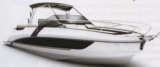
Beneteau Flyer 8.8