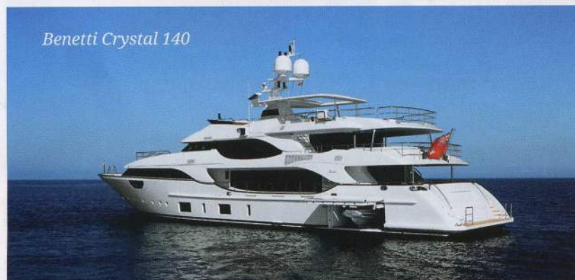
Benetti Crystal 140

Для лучшего увеселения публики в рамках фестиваля проведут несколько любопытных мероприятий. Уже ставший обычным парад яхт дополнится новым элементом. Кроме грациозно дефилирующих новинок разных верфей, в параде примут участие ретрояхты, разбитые на три основных группы: суда до 1975 г.в., с 1976 по 2000 г. и, наконец, суда, построенные после 2000 г. Для них также предусмотрены различные награды. Сама идея, безусловно, интересная. Кроме того, посетители станут зрителями первой в своем роде регаты на гребных досках (SUP — Stand Up Paddleboard). Особенность этих соревнований заключается даже не в том, на каких плавсредствах она будет проводиться,»