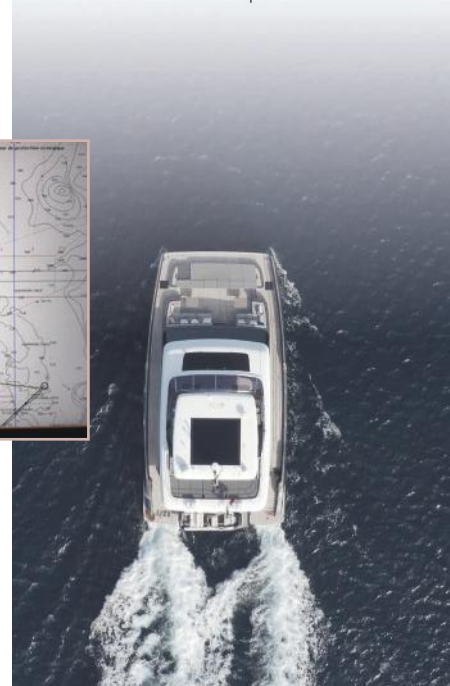
1/ Vacances ? Pourquoi ne pas aller profiter des plus beaux spots de la planète sur un powercat de luxe ? Nous l'avons fait pour vous...