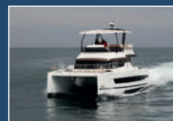
BALI CATSPACE MY