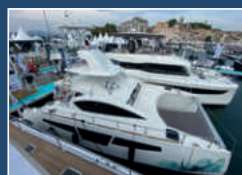
C-CAT 40 POWER FISH