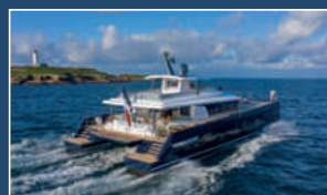
LONG ISLAND 78 POWER