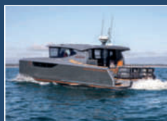
HERLEY BOATS 3400