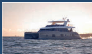
60 SUNREEF POWER