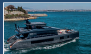
VISION F 80