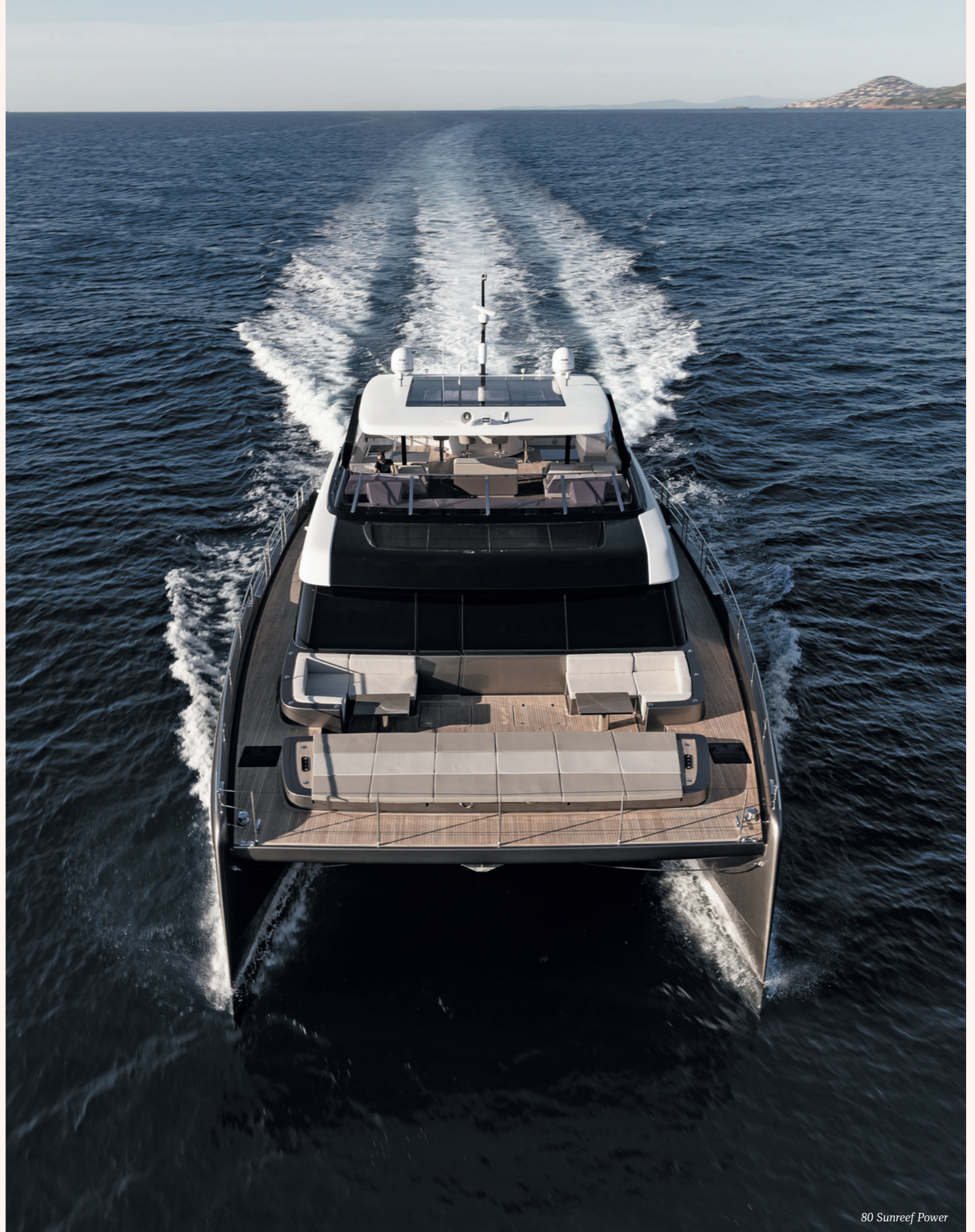
80 Sunreef Power

80 Sunreef Power дал старт новой линейке: New 70 Sunreef Power и New 60 Sunreef Power. По дизайну они будут соответствовать гайдлайнам 80 Sunreef Power, однако больше информации официально не поступало.