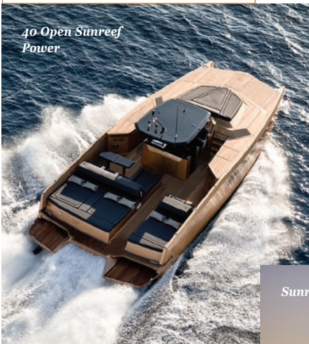
40 Open Sunreef Power