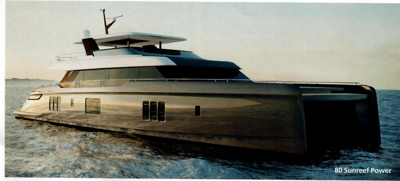
80 Sunreef Power