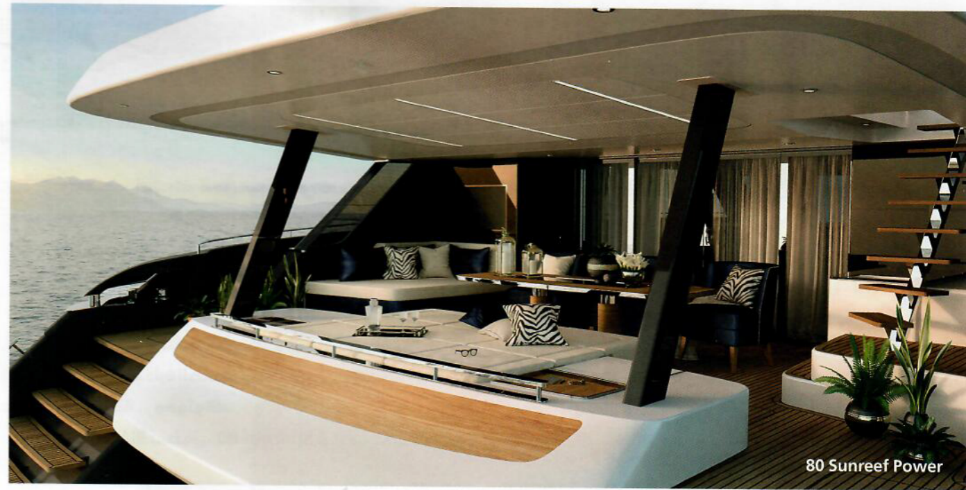
80 Sunreef Power

سيكشف النقاب عن اليخت الحديث 80 Sunreef Power. إنه يخت فخم متعدد الهياكل مثالي للرحلات الطويلة. وهو يتميز بدفع قوي وكاراج مبتكر للجت سكي ومساحات واسعة لقضاء أوقات ممتعة صممت بمواصفات خاصة ومن ضمنها برج القيادة. أما Sunreef Supreme 68 Power فإنه سيظهر كذلك في موقع المراكب الآلية: مساحات الإقامة 300 متر مربع. إنه يخت آلي مزدوج الهيكل يضم جناحاً يحتل كامل العرض مع كاراج خلفي للقارب والألعاب المائية والجت سكي.