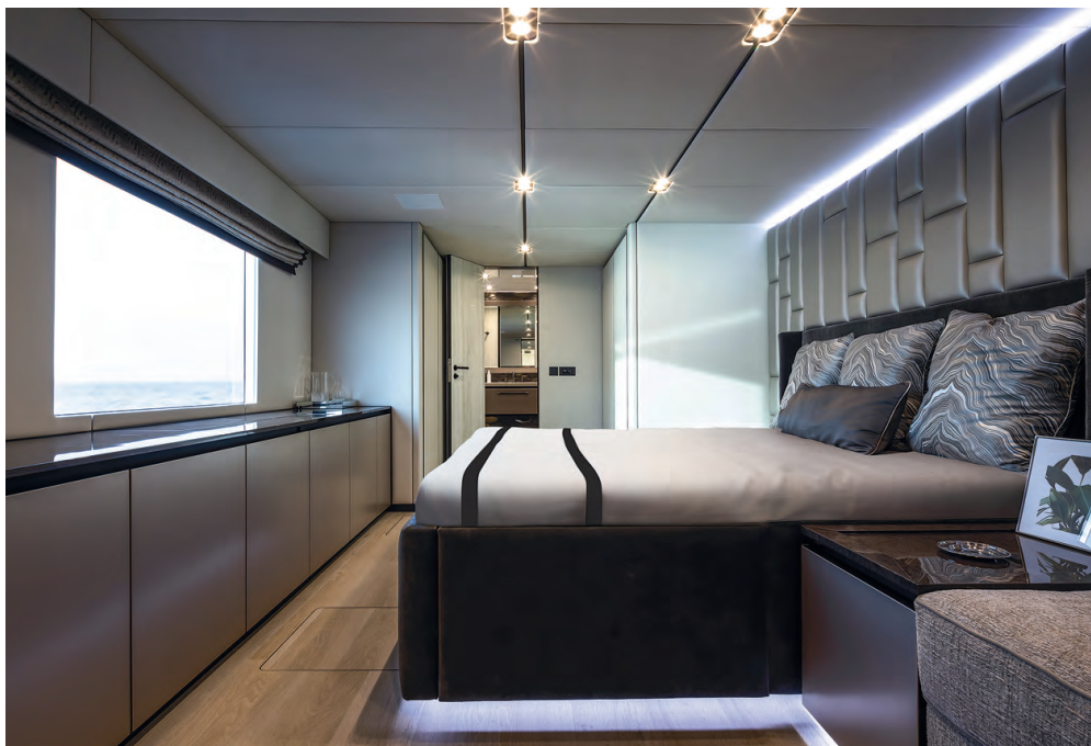
Вверху Кровать в каюте развернута к большому окну. Интерьер выполнен в благородном и сдержанном сером с яркими акцентами.

Надаль купил лодку, имея перед глазами только ее 3D-рендеры – но его уверенность в Sunreef Yachts легко понять. Sunreef Yachts по праву считаются одним из лидеров в производстве катамаранов, и хорошо известны благодаря особому взгляду на лодки: их модели удивительным образом сочетают спортивный характер с необычным вкусом к роскошной жизни. Каждый из их кастомных катамаранов создается, чтобы удовлетворять запросам самых требовательных заказчиков – и в мореходных характеристиках, и в плане комфорта, и в уровне дизайна.