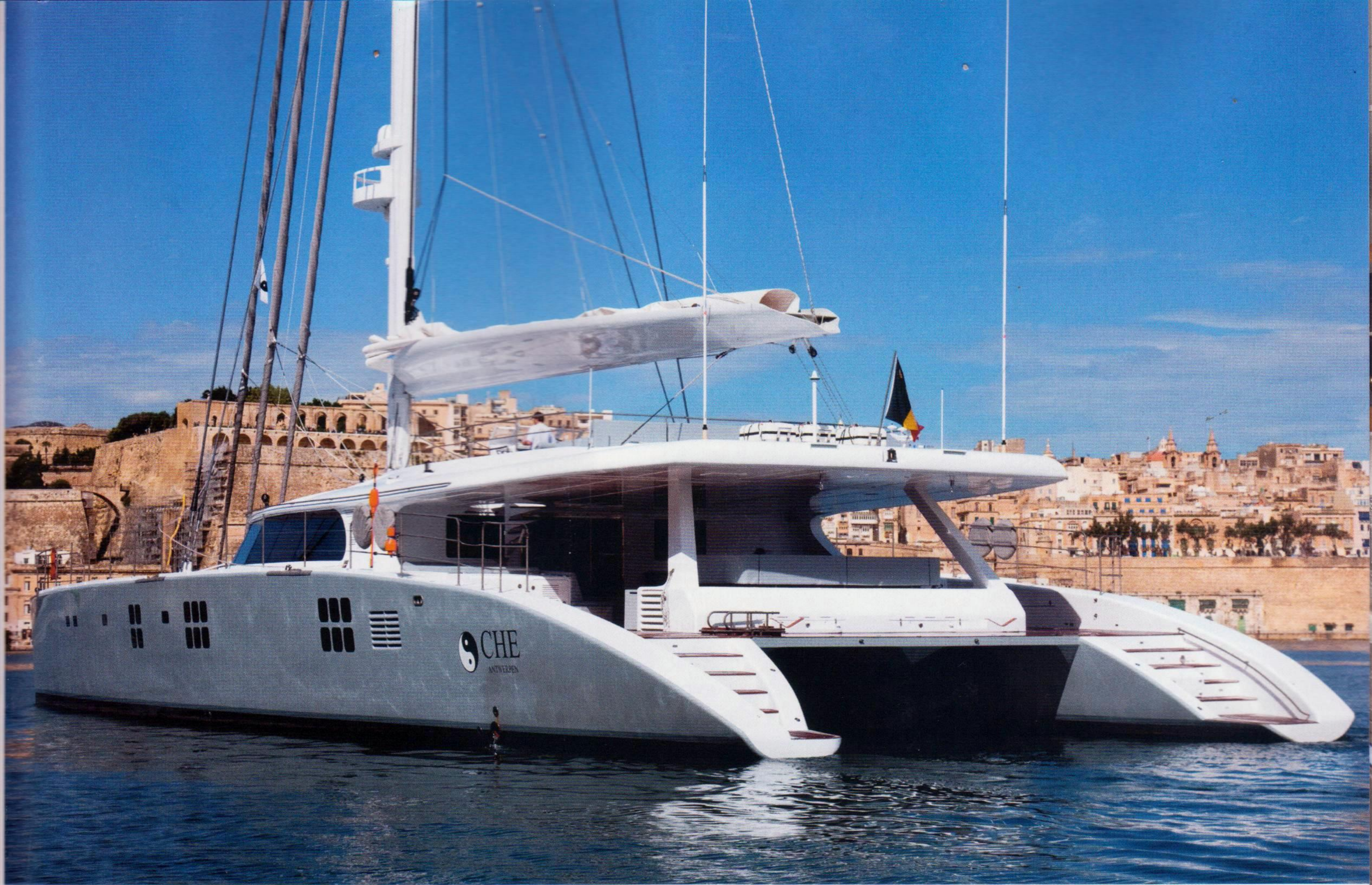
En popa, los dos cascos terminan con una plataforma cada uno, con fácil acceso al agua.

D os años después de que un armador europeo encargase la construcción de este megayate, el 114 pies se botó en las instalaciones que el astillero tiene en Gdansk, Polonia. Si bien es el segundo mayor multicasco del mundo, también se trata del mayor catamarán emparejado en sloop jamás construido.