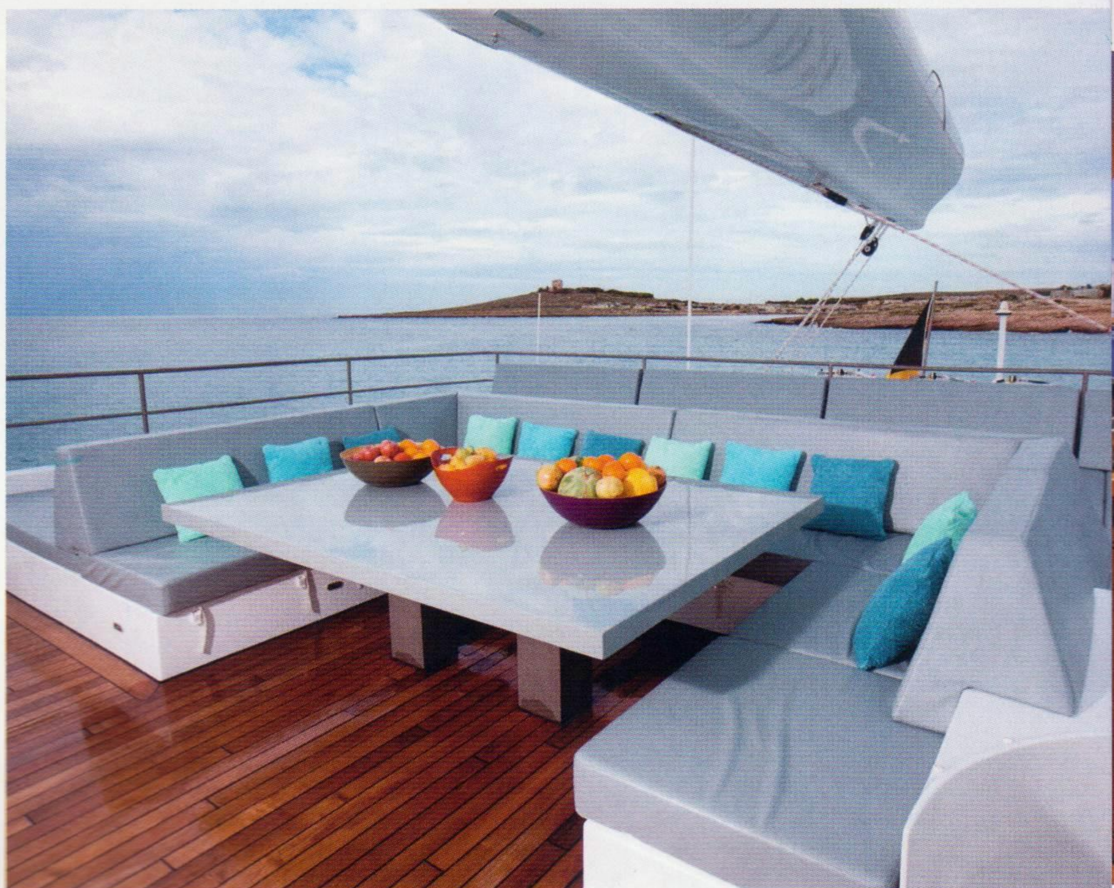
El espacio del flyingbridge se divide entre la zona comedor y solárium y el puesto de mandos exterior.

El "CHE" es un megayate de altas prestaciones, que puede alcanzar los 20 nudos en su máxima velocidad; sobre todo gracias a sus curvas aerodinámicas, a los dos cascos finos y a las formas planas de su conjunto estructural. También ayuda su quilla grande y profunda, que le permite a las velas coger más viento con total seguridad; unas velas hechas de material D4. Además, para facilitar la maniobra en puerto o en fondeo se han instalado hélices de proa.