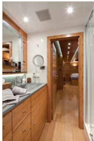
In the main picture: the dining table with dinner service by Thomas Goode. Right: the guest cabins (lit by Davide Groppi wall lights) and, left: a bathroom (with Hansgrohe accessories and Santens linen). / Nel'immagine grande, il tavolo da pranzo con servizio di Thomas Goode. A destra, le cabine ospiti (illuminate da applique Davide Groppi) e, sopra, il bagno (con accessori Hansgrohe e biancheria di Santens).

The materials chosen also help create that sense of psychological and physical balance, as Bertail points out: “The owner and his wife had a lot of input there too. They decided on caramel-coloured bamboo to draw all of the floors and furnishings together and provide a contrast with the grey upholstery and the glossy turquoise of other features.” Bamboo wasn't just an aesthetic choice but a sustainable one too as it's a fast-growing plant and can quickly be replaced once harvested. The owners also wanted mo-